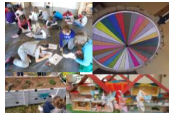
Des activités diverses et variées