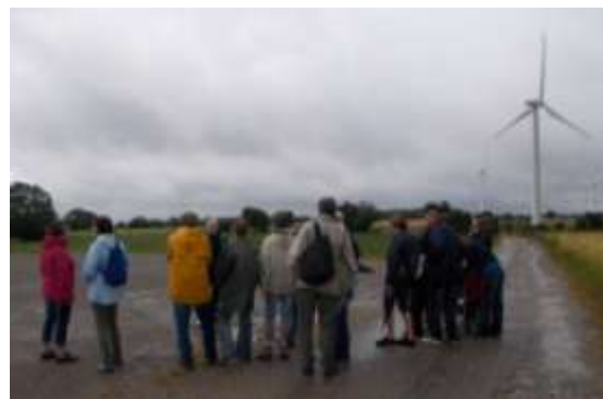
Des balades au grand air