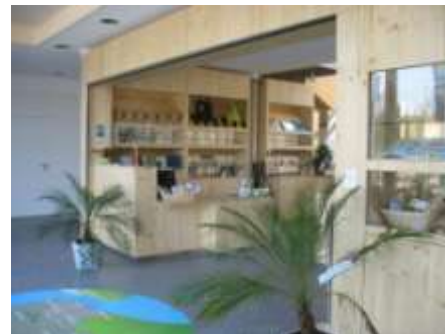
Une boutique de souvenirs