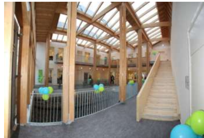
Un lieu unique !