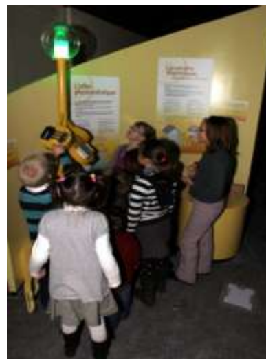
Une scénographie interactive