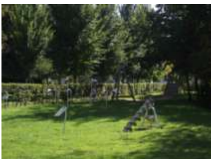
Un jardin avec des jeux surprenants